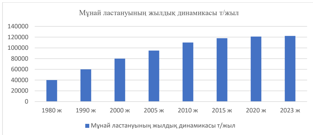
Диаграмма 1. Мұнай ластануының жылдық динамикасы т/жыл