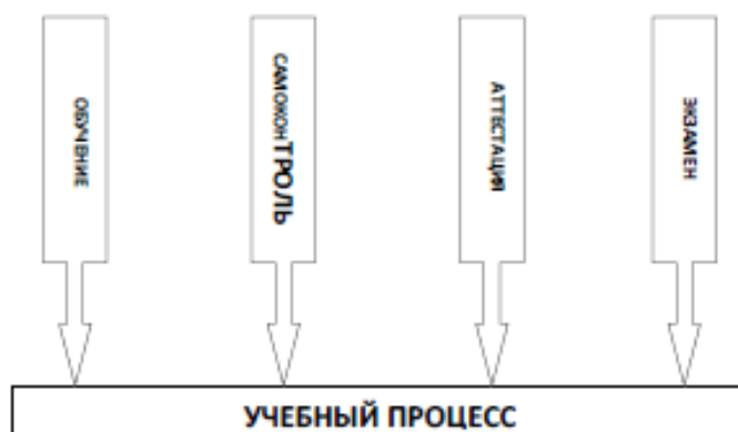
Рисунок 2. Компоненты организации учебного процесса

В особых случаях, если возникают проблемы, связанные с пониманием материала, студент лично обращается к преподавателю за разъяснениями. Но это бывает редко и преподаватель более детально отвечает на индивидуальные вопросы студента, а не дает информацию по общей абстрактно схеме.