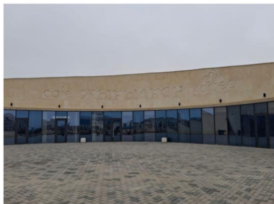
Сурет 9 - Жығылған кафесі

• Yesenov Stadium – университет стадионы мәдениеттанулық тұрғыдан дене мәдениеті, ұжымдық эмоция және университеттік қауымдастықтың символдық бірлігі қалыптасатын көпфункционалы мәдени кеңістік болып табылады. Ол университетті тек интеллектуалдық емес, физикалық және әлеуметтік тұрғыдан да дамытатын тұтас мәдени институт ретінде көрсетеді.