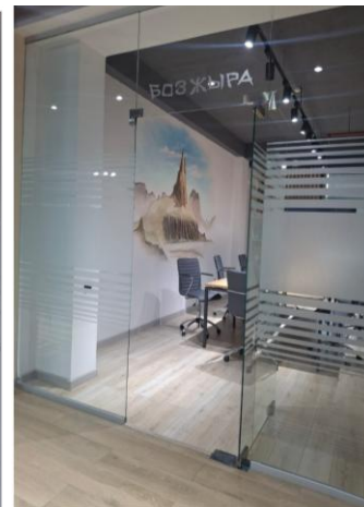
Сурет 7 – Бозжыра залы

3. Ашық алаңдардағы арт-инсталляциялар. Университет кампусы мен ауласы білімалушыларға шабыт сыйлайтын арт-нысандармен жабдықталған. Мысалы: