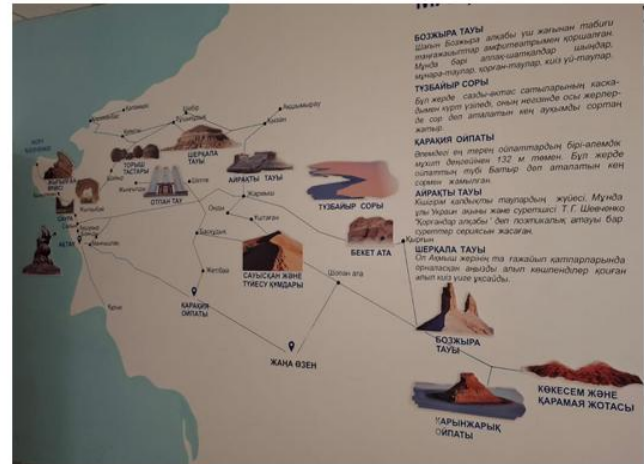
Сурет 4 - Маңғыстаудың киелі мекендері

Мұндай мәдени ақпараттардың тұрақты түрде көзге көрініп тұруы білім алушылар үшін тарихты визуалды қабылдауды, білімді есте сақтауды, талдау дағдыларын, мәдени қызығушылықтарды дамытуға көмектесіп, білімалушылар арасында пікірталасқа, жобалық жұмыстарға, презентациялар жасауға себеп болады.