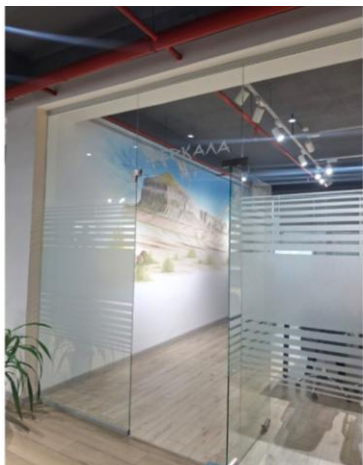
Сурет 5 – Шерқала залы

Бұл тізім әлі де толығы түсері анық. Дегенмен, университеттегі тұлғаларға аталған аудиториялар білімалушылар үшін тек оқу орны емес, құндылықтар мен мағыналар тоғысқан символдық білім кеңістігі болып табылады. Олар білім беру үдерісін мазмұндық тұрғыдан байытып, студенттердің тарихи сана-сезімін, тұлғалық мотивациясын және мәдени сәйкестігін қалыптастыруда стратегиялық маңызға ие. Сонымен қатар атаулы аудиториялардан бөлек Маңғыстаудың киелі табиғи нысандарымен аталатын Шерқала, Үстірт, Бозжыра (5-6-7-суреттер) кеңес залдары университет кеңістігіне аймақтық тарих пен мифологиялық нарративтерді енгізеді. Бұл П.Нора тұжырымдаған «естелік орындарының» университеттік форматтағы көрінісі ретінде қарастыруға болады.