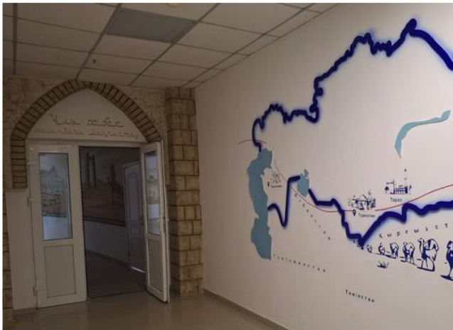
Сурет 3 - Ұлы жібек жолы тармақтары