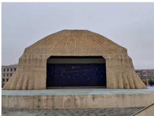
Сурет 8 - Шерқала сахнасы

• Шерқала сахнасы (Жығылған кафесі) – мәдениеттанулық тұрғыдан өңірлік жады және университеттік бірегейлік тоғысқан символдық кеңістік болып табылады (8-9-суреттер). Ол университетті білім беру мекемесі ғана емес, өңірлік мәдениетті сақтап, жаңаша ұсынатын мәдени орталық ретінде танытады. «Шерқала», «Жығылған» атауларының өзі өңірлік мәдени жадымен тікелей байланысты символ болып табылады және университеттік қауымдастықтың ұжымдық бірегейлігін қалыптастыруға ықпал етеді. Ортақ іс-шаралар арқылы білімалушылар мен оқытушылар өздерін бір мәдени кеңістіктің қатысушысы ретінде сезінеді. Сахнада өткен маңызды оқиғалар университет жадысында символдық түрде бекітіліп, ортақ естеліктер мен дәстүрлерді қалыптастырады.