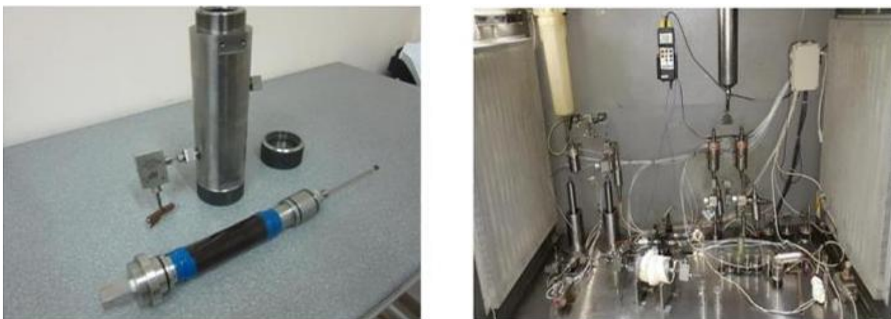
Рисунок 1 – Лабораторное оборудование и схема проведения керновых исследований по вытеснению нефти