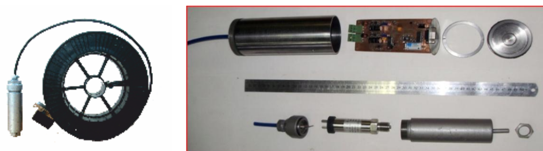
Рис. 1. Общий вид устройства

Опытная эксплуатация прибора в лабораторных и полевых условиях позволяет сделать вывод об эффективности применения его для измерения количественных и качественных показателей подземных вод в автоматизированных системах непрерывного мониторинга [4,5].