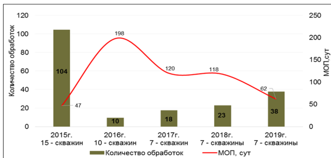
Рисунок 1 - Динамика МОП по скважинам за период 2015-2019гг.

Анализ данных показывает, что применение тепловых обработок способствует восстановлению работоспособности скважин. При этом эффективность мероприятий зависит от количества обработок, химического состава нефти и гидродинамических характеристик каждой скважины, что подчеркивает необходимость индивидуального подхода к планированию эксплуатационных мероприятий. Кроме того, результаты анализа позволяют оценить динамику образования органических отложений в различных условиях эксплуатации и выявить наиболее уязвимые скважины, требующие повышенного контроля. Данный подход обеспечивает возможность оптимизации программы профилактических и восстановительных работ, сокращения простоев оборудования и снижения эксплуатационных затрат. Для дальнейших исследований рекомендуется внедрение комплексных методов контроля и прогнозирования образования парафиноасфальтосмолистых отложений с учетом химического состава нефти и температурного режима пласта.