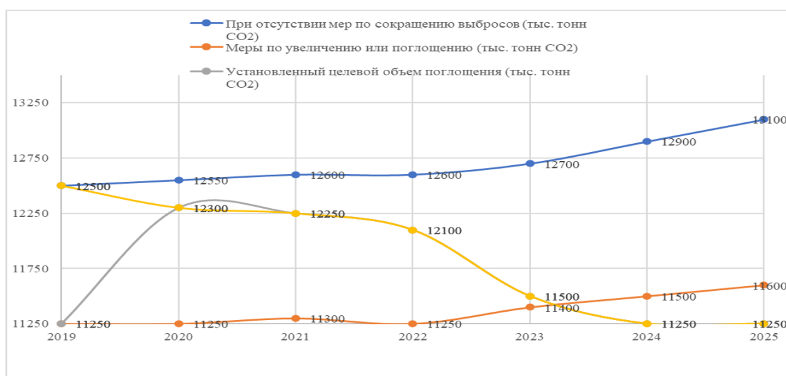
Рисунок 3. Вариативность сценариев выбросов и поглощения парниковых газов в 2019–2025 гг.*

Для достижения углеродной нейтральности необходима комплексная трансформация отраслевой структуры экономики, включающая диверсификацию энергетического баланса с увеличением доли возобновляемых источников энергии, активное внедрение энергосберегающих технологий в металлургическом секторе, а также использование передовых методов улавливания и сокращения углеродных выбросов в нефтегазовой промышленности. Последовательная реализация указанных мер позволит, по оценкам, сократить совокупные выбросы парниковых газов в Республике Казахстан на 25–30 % к 2030 году.